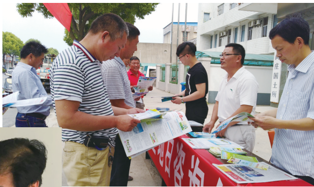
日前,龙冈镇国土所在“6·25”国土宣传日期间,结合“万名代表大走访”主题实践活动,深入到群众家中征求意见和建议56条。

▶6月25日上午,尚庄镇国土所以“节约集约利用资源,倡导绿色简约生活——讲好我们的地球故事”为主题,开展丰富多彩的科普宣传。