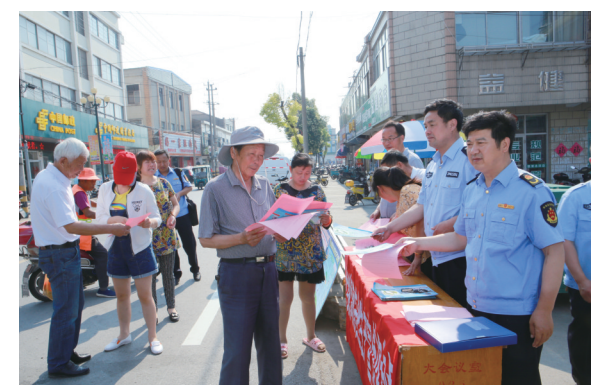
日前,大纵湖镇组织安监、食安、工商、供电等12个部门单位走上街头,开展安全常识和法律法规普及、安全生产咨询服务活动,在全镇营造“关爱生命、关注安全”的舆论环境和社会氛围。

据介绍,我区是全国新教育实验区,邀请家长参与监考是推进“新教育实验·家校合作共建”的创新举措,也是学校教育和家庭教育相结合的有益探索。在监考家长的聘请与安排过程中,我区各学校也作了不少思考,比如不安排家长监考自己孩子班级,减轻学生心理负担;不同场次邀请不同家长参加,扩大家长参与面;将家长走进考场监考与宣传创文、创卫工作相结合等。“今后,我们还将加强家校沟通的探索,努力探寻更好的家校合作平台,让家庭教育与学校教育相得益彰、互促共进,让教育发展更加科学,师生成长更加幸福。”区教育局局长熊新华如是说。