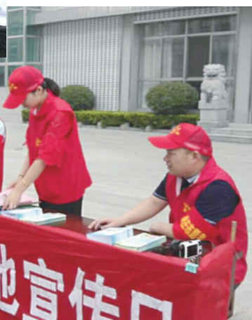
▲6月25日上午,张庄街道国土所的志愿者们设立现场咨询台,向过往群众发放宣传资料,面对面向群众宣传农村宅基地政策、国土资源法律法规知识等,接受群众咨询50余人次。