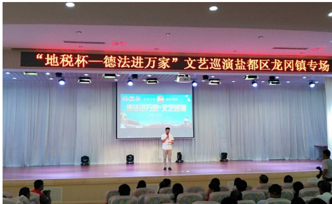
“地税杯——德法进万家”文艺巡演活动

近年来,我们龙冈镇卫生院坚持以党的十八大、十九大和习近平总书记系列重要讲话精神为指导,以深化平安法治建设为契机,全力推进依法治院建设,深入开展“法治进单位”活动,促进法治医院创建,积极打造人民群众满意医院,切实保障人民群众身体健康,促进社会和谐发展。