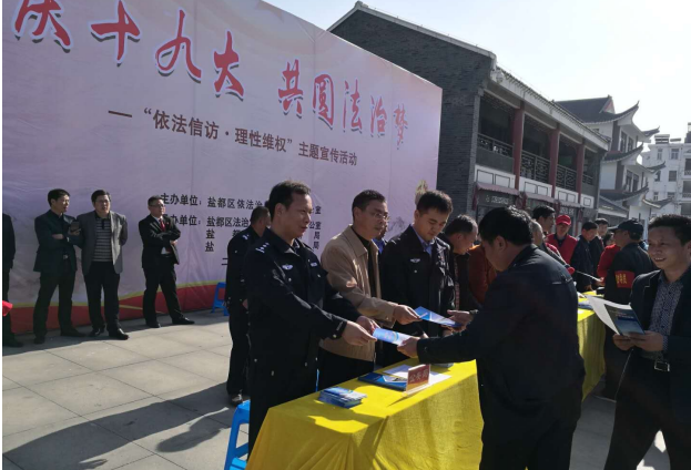
开展“依法信访 理性维权”主题宣传活动