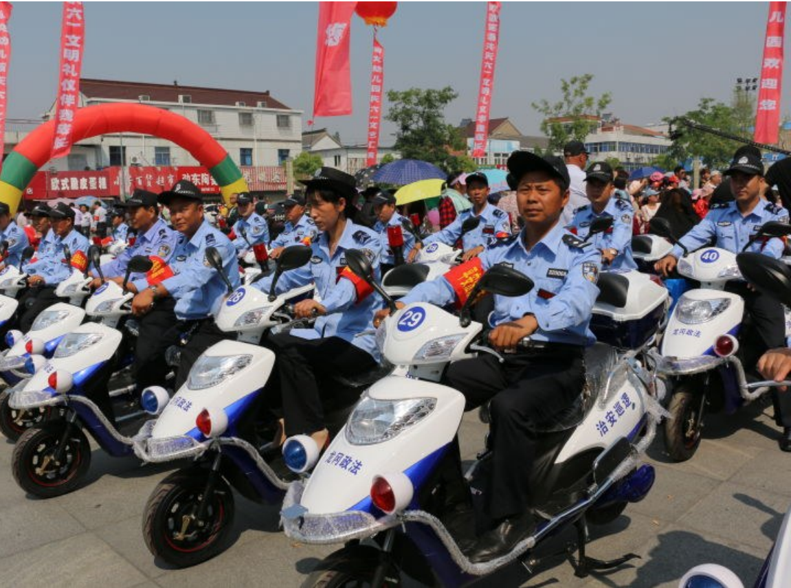
平安法治志愿者队伍

下一步,我镇将以党的十九大精神及习近平新时代中国特色社会主义思想为指引,进一步加强党对法治建设工作的组织领导,依法行政,依法执政,力推全镇法治建设工作再上新台阶。