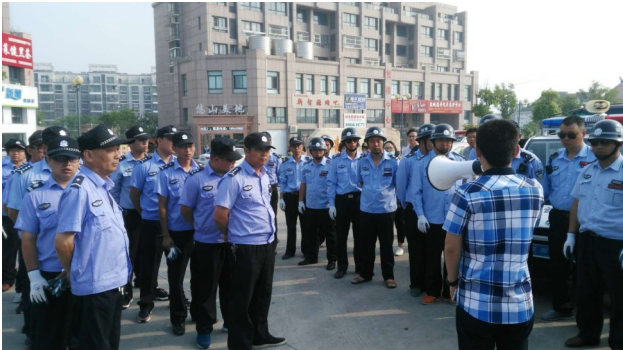
组织开展联合执法活动