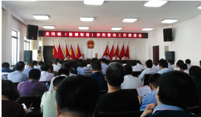
涉轻整治工作推进会