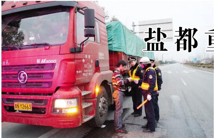
春运第一天,盐都运管全面加强道路运输市场监管,严厉打击“黑车”等非法营运行为,共出动运管稽查人员 26 人次,出动稽查车辆 12 台次, 检查车辆 85 辆次, 努力保障旅客和道路运输经营者的合法权益。

本报讯(严俊 仇金留 祁瑞震)1月31日凌晨3点20分,在204国道冈中公路超限检测点,路政执法人员紧张而有序地布岗,拉起警灯,穿戴反光标志服、摆放警示标志牌……由我区路政大队、运管稽查大队、交通警察大队以及滨海、建湖路政大队联合组成的多单位、多部门联合执法治超行动正式开始。