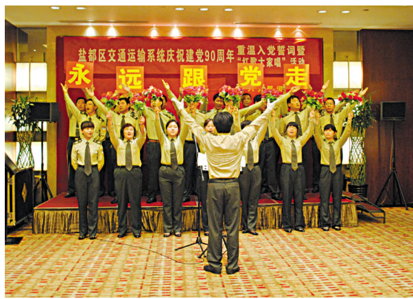
6月25日,区交通运输局组织开展“红歌大家唱”比赛活动。图为演出一角。

刘桂琦介绍,目前,该街道党委已落实一系列的具体措施:一是只争朝夕抓项目。全力主攻特色产业招商选资,扎实开展动迁安置、项目建设“百日会战”,聚力推进风电齿轮、规划展示馆等项目建设,加快东风齿轮、日盛纺织等项目落户进程和特色产业集聚步伐。二是聚集力量建园区。加快推进富康路拓宽、政通路和康庄大道西延及项目区动迁,确保年内园区二期1500亩配套到位,快速建成特色产业集聚平台。三是提速打造新城区。按照盐都新城定位和城市化建设要求,加快振兴路拆迁建设、盐淮线整治出新、老集镇组团开发、新集镇形成架构,合力共建新城区板块。四是奋力夺取“双过半”。以“三服务”为抓手,帮助企业协调要素、融通资金、接足订单、打足工时,确保财政收入、注册外资实际到账等各项指标“双过半”,为打赢“十二五”开局战、建设现代化新城区奠定坚实的基础。