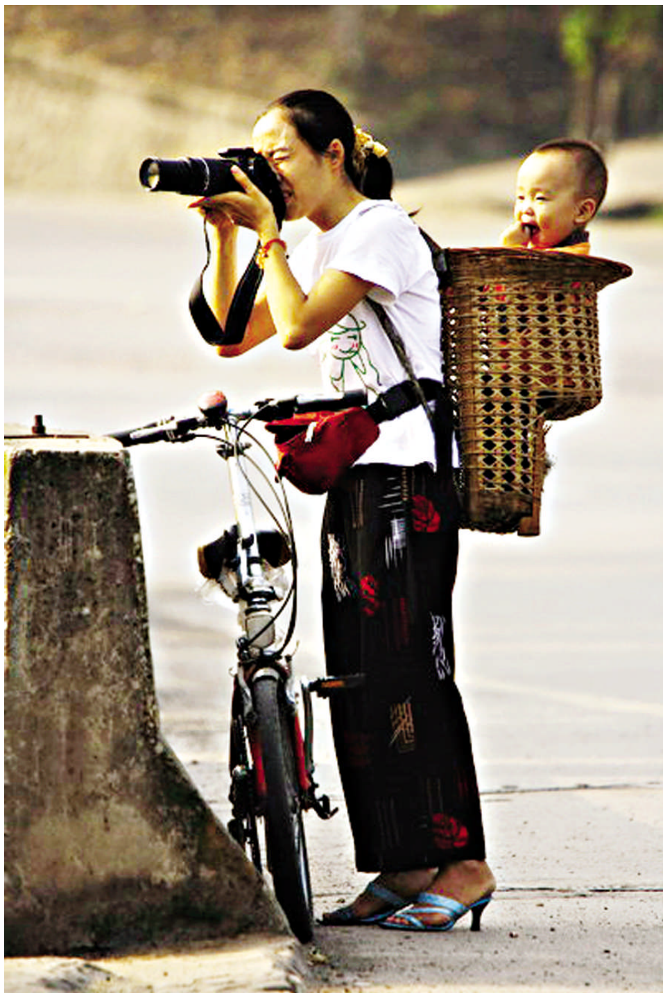
爱好摄影的妈妈