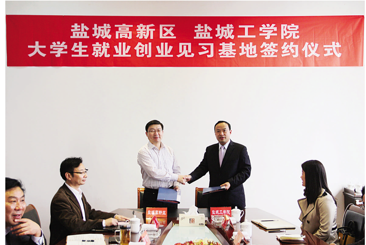
10月21日,高新区与盐城工学院大学生就业创业见习基地签约仪式在高新区举行。双方将结成技术创新战略联盟,在科研成果转化、高端人才引进、研发平台共建等方面,加强协同创新,开展有效合作,助推高新区向“国家队”迈进。

连日来,冈中街道不失时机争主动,一着不让抓当前,以秋播为抓手,积极组织机关干部深入村组、田间地头指导农民秋收秋种,扎实推进农业产业化和高效农业发展。图为同桂村机手刘定如正在为农户进行免耕机条播。