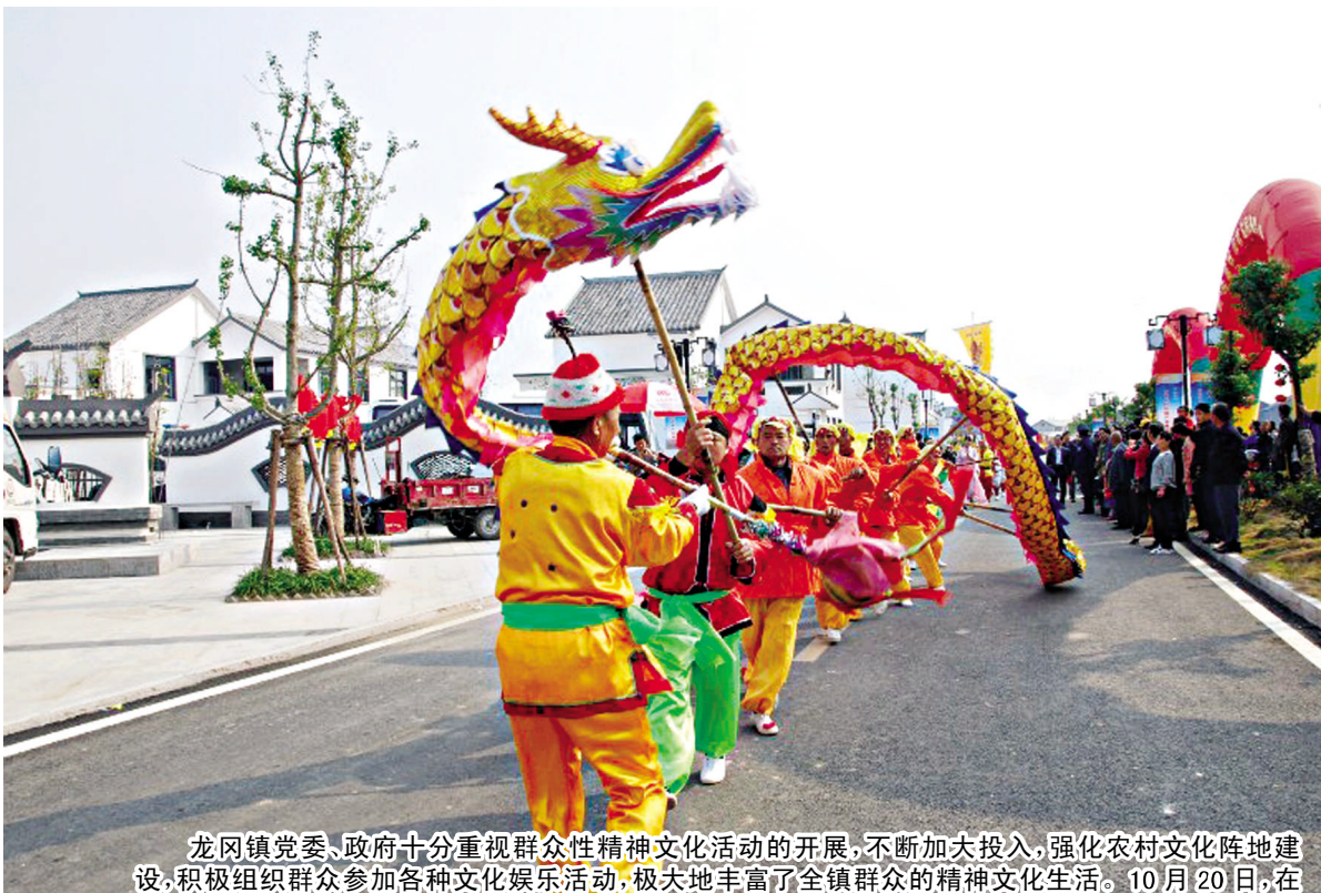
龙冈镇党委、政府十分重视群众性精神文明活动的开展,不断加大投入,强化农村文化阵地建设,积极组织群众参加各种文化娱乐活动,极大地丰富了全镇群众的精神文化生活。10月20日,在大湖镇举办的2013年“起桦杯”第二届里下河地区广场舞邀请赛中,该镇龙舞代表队参加了踩街、龙舞表演等民俗文化活动,被龙舞大赛组委会评为“最佳表演奖”。

马成志听取了该企业负责人对相关情况的汇报,实地察看了企业的生产经营状况,详细了解新厂区选址情况。他要求,盐都区要建立“一套班子、一套方案”的服务机制,帮助启恒户外用品项目尽快实施整体搬迁,促进企业做大做强。各部门要主动深入企业调研,熟悉企业情况,加大对企业的引导与扶持力度,进一步落实好中央和省、市出台的扶持企业发展的政策措施。要密切关注企业的生产经营状况,想方设法帮助企业解决生产经营中遇到的困难和问题,为企业发展提供更好的环境。