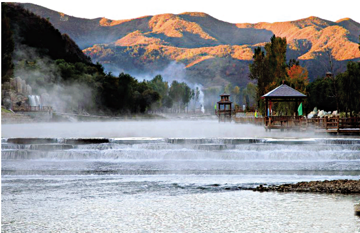
金秋时节，北京市怀柔区“天河川旅游风景观光带”湖光山色，美景如画。