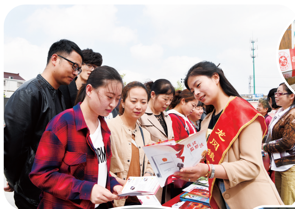
▲5月10日,高新区盐夹街道通过建设一条廉政文化长廊、组织一堂廉政教育党课、举办一次《监察法》集中宣传展示等活动,切实加强党员干部党纪作风廉政和反腐败教育。图为该街道党员干部正在学习《监察法》。建喻 高静 丛华 摄

场调试,最终圆满将该机床交付使用,还取得‘一种用于飞机尾翼安定面加工的专用夹具’的实用新型专利。”除了技术上孜孜不倦地追求,作为一名年轻的基层人大代表,徐保群心中时刻牢记自己是群众的代言人的誓言,平时一有时间他就和工人们待在一起,采用各种方式、利用各种机会听取来自基层群众的心声,他以其过硬的技术和平易近人的工作作风赢得单位同事的一致好评。采访中,徐保群表示:“荣誉只能代表过去,未来的工作充满挑战,更催人奋进。我将不断加强学习,努力提高专业水平,发奋工作,力求把工作做得更好更细更扎实,在自我进步的同时帮助他人,将劳模精神传承下去,为地方经济社会发展作出应有贡献。”