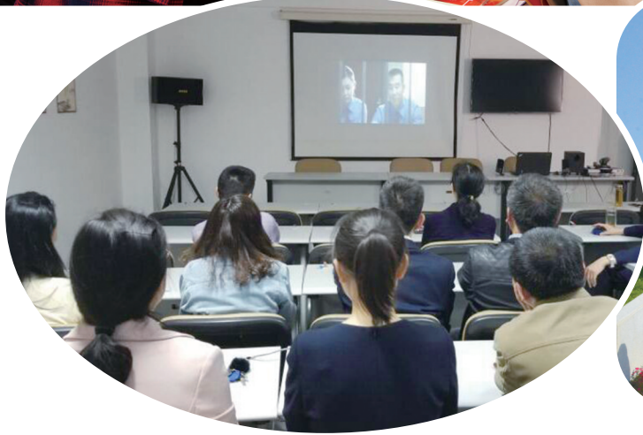
▲5月10日,区审计局组织全局干部职工观看廉政微电影,开展讨论交流,增强廉洁自律意识,筑牢“不想腐”的思想自觉。