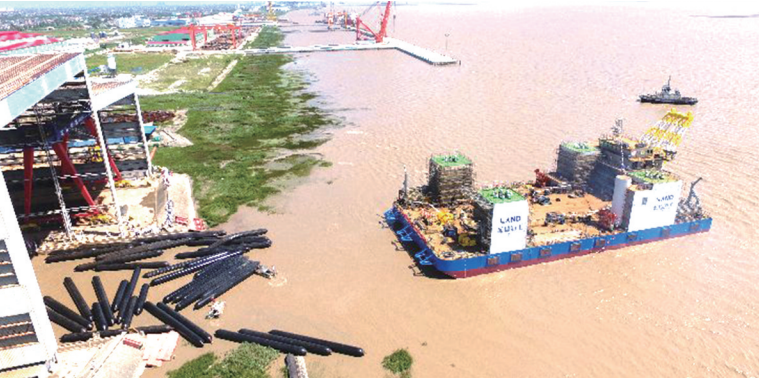
郭猛镇积极融入沿海开发战略,引导传统疏浚打捞企业由江入海,转型进军海上风电设备安装行业。近日,该镇境内的江苏蓝德海洋工程有限公司瞄准海上风电市场,引进的集安装与维护为一体的自升式海上风电作业平台成功下水试航。该平台全长120米、型长78米、型宽38米、型深6.8米、吃水3.8米,可完成叶轮整体吊装或其他需要翻身、维护的作业,基本覆盖我国沿海区域风电场的需求。图为该公司“华电稳强”号海上风电作业平台。

据介绍,盐都今年教师体检工作从8月初开始,首先安排在职教师进行体检,新学期开学后,各镇(街道)和区直学校对退休教师体检进行安排实施。所有教师的体检全部安排在三甲医院——盐城市第三人民医院,体检套餐根据教师性别和年龄等实际因素作出相应安排。