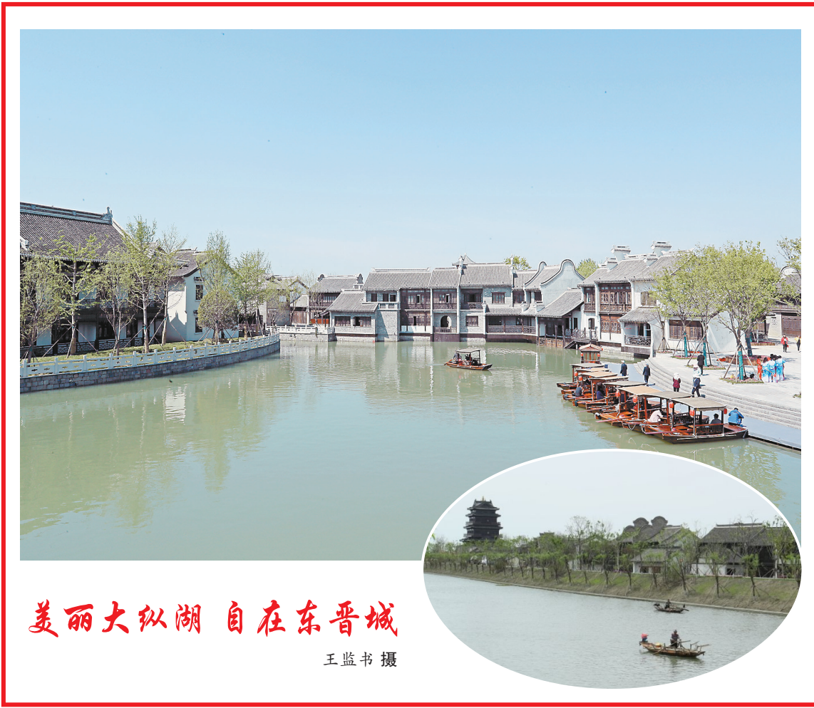
美丽大纵湖 自在东晋城

动为抓手,不断压紧压实“三个责任”,强化重点行业领域安全监管,严格排查各类安全风险隐患,狠抓源头治理,提升本质安全水平,切实维护人民群众生命财产安全。他强调,创建全国文明城市已进入决战决胜阶段,潘黄街道要全力以赴、慎终如始,以归零心态继续做好创建各项工作,严明责任,凝聚合力,联创联建,群创群建,全面落实“十没有”“二十有”标准,真正下足“绣花”功夫,努力