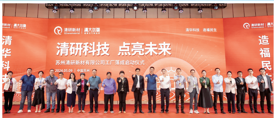
清研新材工廠落成啟動儀式

個、張家港市領軍人才超10個。政隆物流獲評蘇州市服務業數字化轉型成效明顯企業。企業活力有效激發。引導企業加大研發投入,新增發明專利授權450件,企業研發投入超60億元,全市排名第一。沙鋼集團獲評國家科學技術進步獎二等獎、省科學技術獎一等獎,入選第二批省內外貿一體化試點企業,中美超薄帶5G工廠成為全市首個國家級工業互聯網試點示