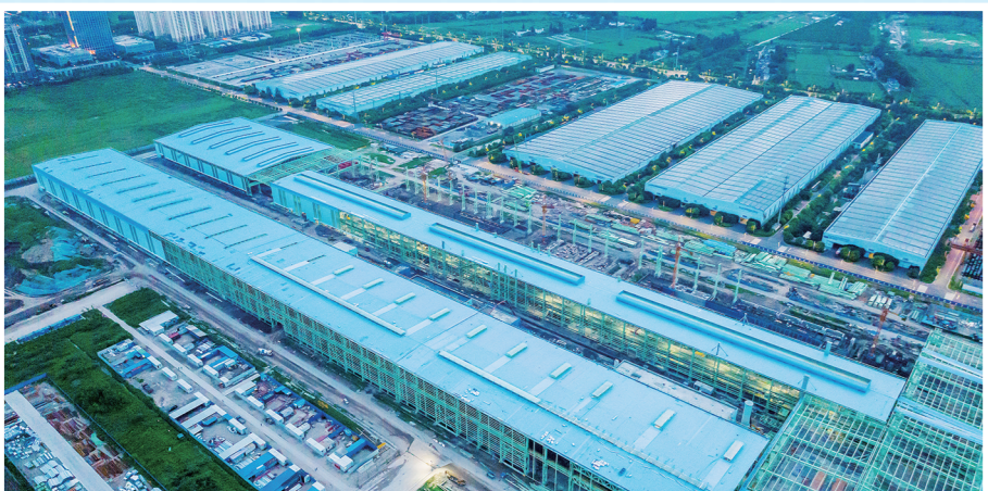
沙鋼高品質硅鋼項目