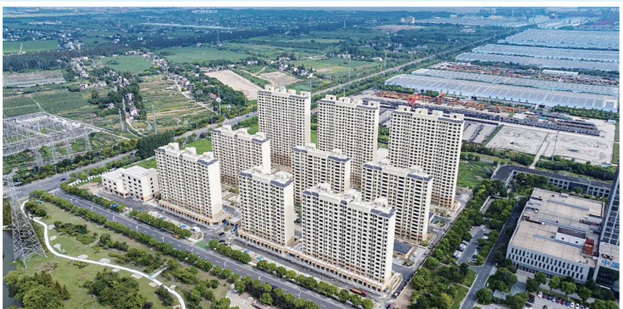
悅隆新村安置房項目交付使用