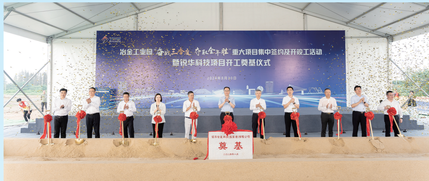
銳華科技項目開工奠基儀式