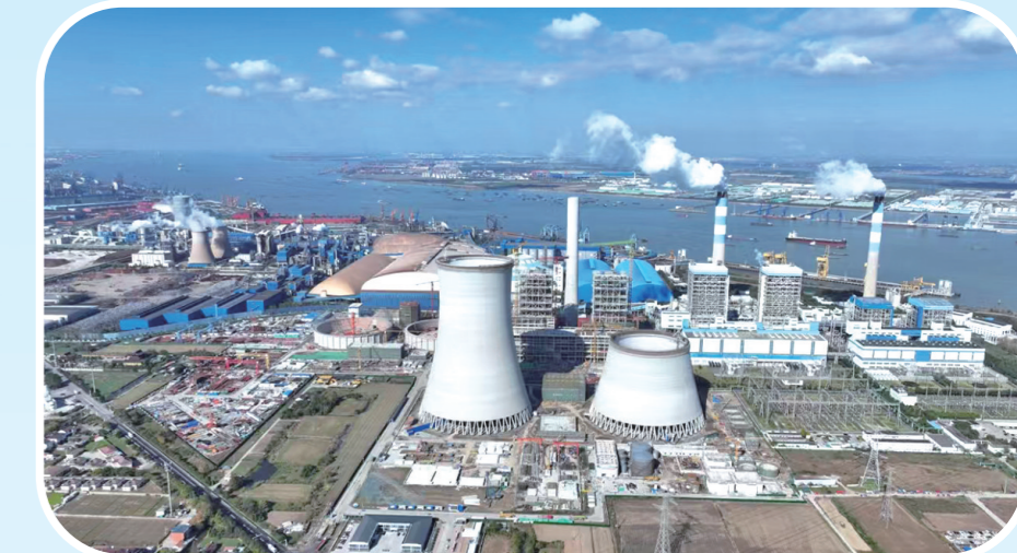
國信沙洲兩台100萬千瓦清潔高支撐性電源項目

村級經濟提速進位。特色農業“破圈出彩”,改造高標準農田1715畝,入選省級農業農村重大項目2個,成立農文旅公司,建成拾光書舍、楓和特種养殖、壘上拾光等特色農文旅融合項目。載體經濟“乘勢而上”,揚子江系列產業園綜合出租率提高10%以上。光伏經濟“增量加碼”,并網項目48個,裝機容量達33.73兆瓦,推動村集體經營性收入同比增長12%。公共服務擴面增效。聚焦群眾“急難愁盼”,實施5大類21項民生實事工程。優質醫療精準供給,錦豐醫院綜合樓按期完工,創成省級村衛生室3個。“沙洲教育”不斷進步,合興小學被認定為全國國防教育示范學校,合興初中獲評全國青少年校園足球特色學校,沙洲幼兒園獲評省優質幼兒園。新增就業人數1450人,創成