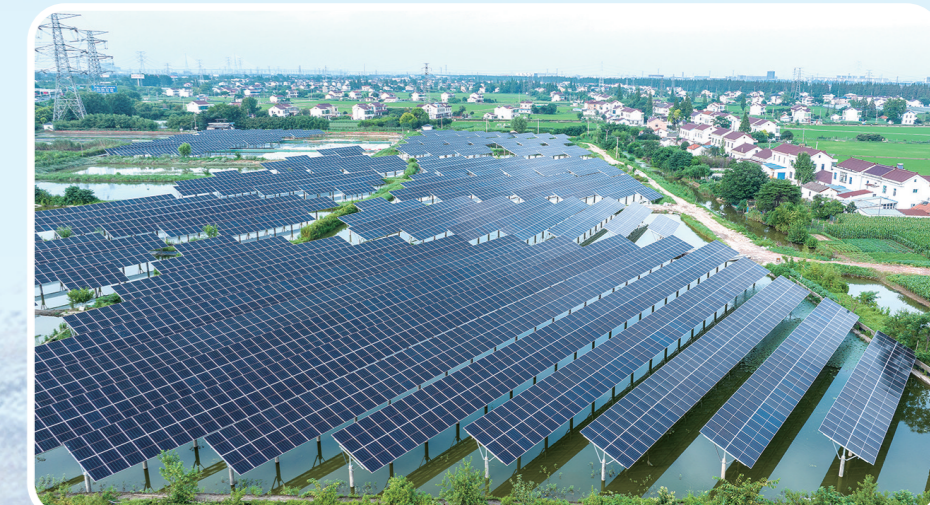
交通村漁光互補項目

效能政府建設刷新滿意度。高標準開展黨紀學習教育,組織機關390名在職黨員常态化聯系服務村(社區),解決群眾急難愁盼200余件。深化政務服務改革,豐富便民利企系列“一件事”套餐,辦理“幫代辦”企業事項297次,發出全市首張“農村建房一件事”不動產證。成立運作園產業集團,成為全國同層級首創、全市各板塊首家具備外部主體信用評級的產業集團公司。開展機關降本增效行動,減少第三方服務開支800余萬元。法治政府建設刷新滿意度。嚴格履行行政主要負責人法治建設第一責任人職責,法治建設更加惠企利民。推出“法企同行·親清共建”尊商護商十條公開承諾,村(社區)法律援助聯系點實現全覆蓋,辦理法律援助案件19件,惠及困難群眾292人,獲評蘇州市2023年度法治政府建設