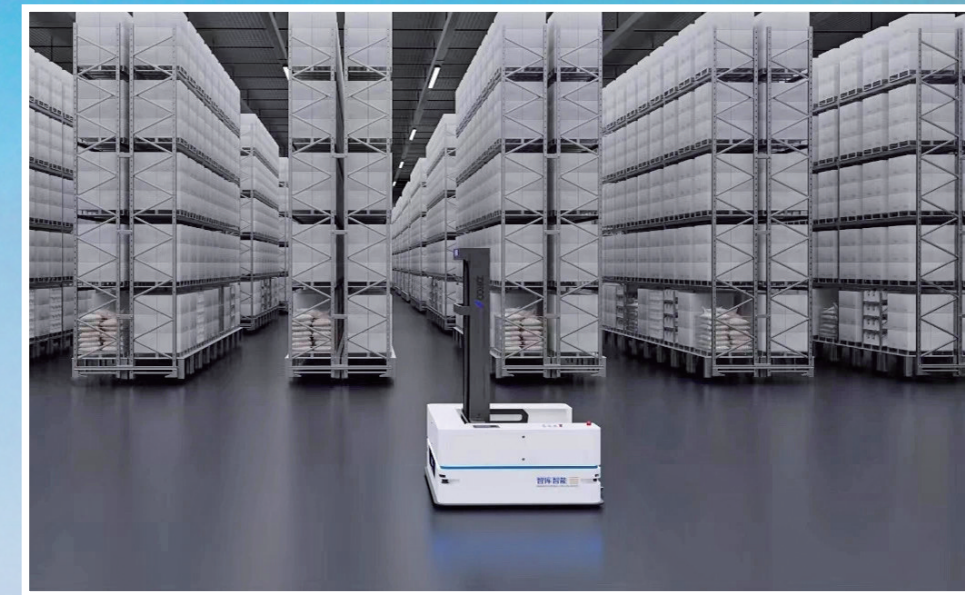
江苏智库智能科技有限公司