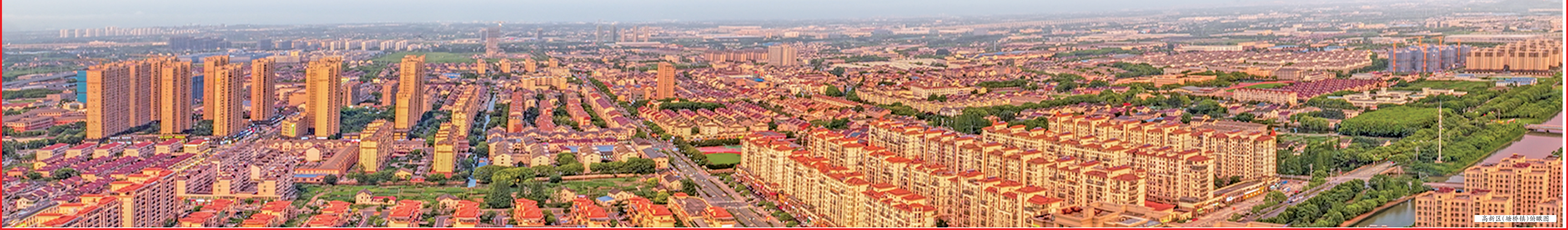
高新区(塘桥镇)俯瞰图