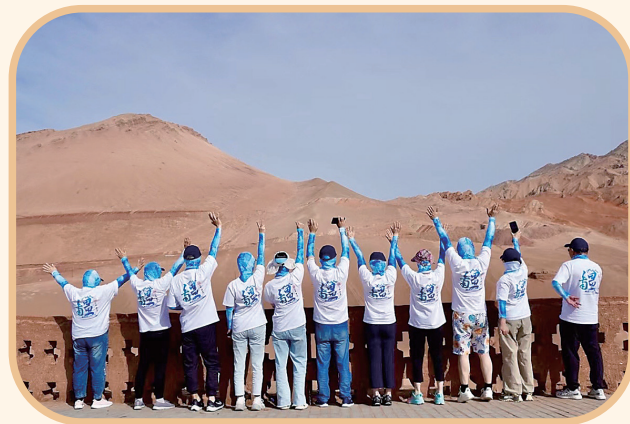
乐在旅途