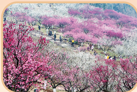
香山赏梅